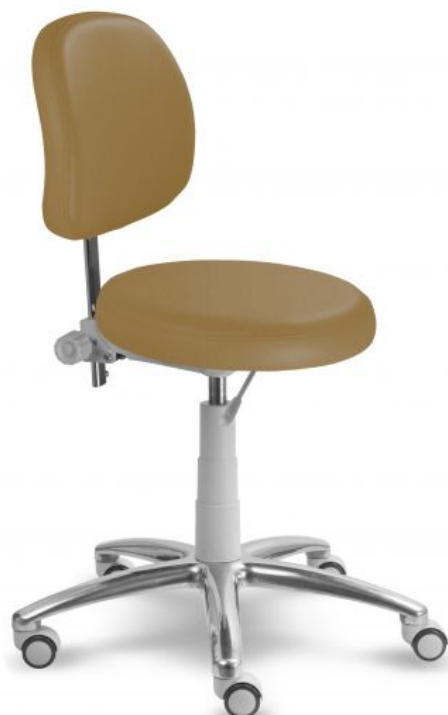
Ilustrační foto (mechanika):