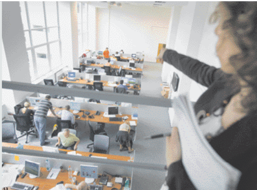
Vlevo newsroom z roku 1900 (Richmond, Virginia Baptist Newspaper) a vpravo zpravodajský sál vzor 2008 (Praha, televize Z1). „Když jsem tak nějak kočovala, atmosféra v open space mi vyhovovala. Ale když chce člověk zakořenit, rád by si vytvořil i vztah k pracovišti,“ říká jedna z odpůrkyn velkokancelářů.