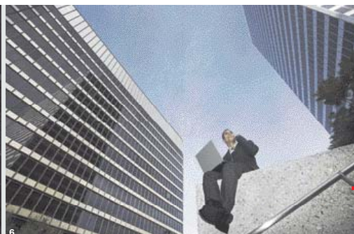
Mnozí zaměstnanci nemají ve firmě nárok na stále pracovní místo, snaha vytvořit si útulný koutek je marná.