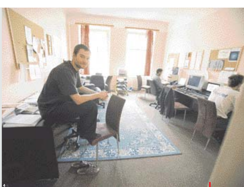
Vtěstnat co nejvíce lidí do určeného prostoru. Hlavně takové zadání plní projektanti nových velkokanceláří - často bez větší invence. Málokterá firma chce utrácet za dobré architektky.