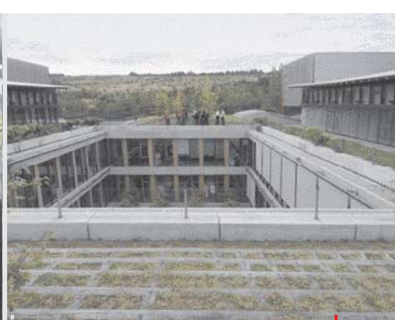
„Do ničeho takového nepůjdu,“ hrozila řada pracovníků ČSOB před stěhováním do nové centrály (na snímku). Banka do přesvědčovací kampaně nasadila i psychology specializované na oběti násilí.